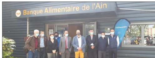
Les producteurs locaux et les élus du département étaient invités à visiter les locaux de la Banque alimentaire 01.

Parmi la quinzaine de producteurs retenus par le Conseil départemental, quelques-uns (La Ferme de Jossierand à Maintenay-Montlin, L'abattoir Gesler Hotonnes à Haut-Valromay, l'EuropéAin à Bourg, La ferme de Collonges, La ferme de Tanvol, La coopérative d'Étrez ou encore la fromagerie la Combe du Val) ont participé à cette visite.